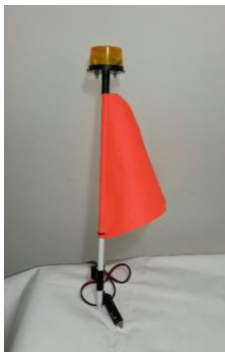
Антенa „Buggy whip“ с мигаща светлина