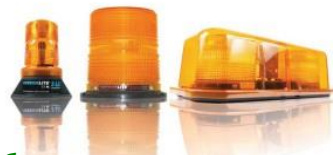
Стробоскоп или мигащи светлини