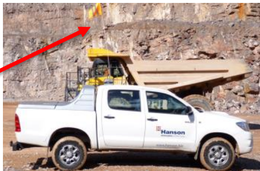
Антенa „Buggy whip“